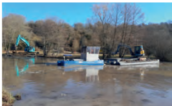
Mise en place des sédiments lacustres avec un pelle mécanique et une plateforme flottante

Cet apport de matière a permis de rehausser le fond de la bordure lacustre qui avait été déblayée dans les années 1970 et de faire varier les hauteurs d'eau. Ces sédiments ont constitué un substrat parfait pour le développement d'un herbier.