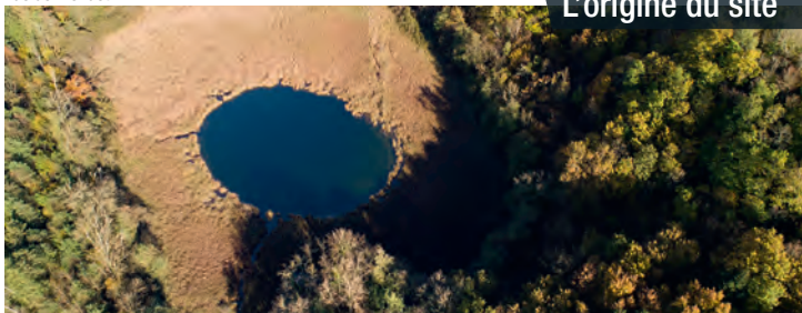
La Grand blachère : lac de Pugieu